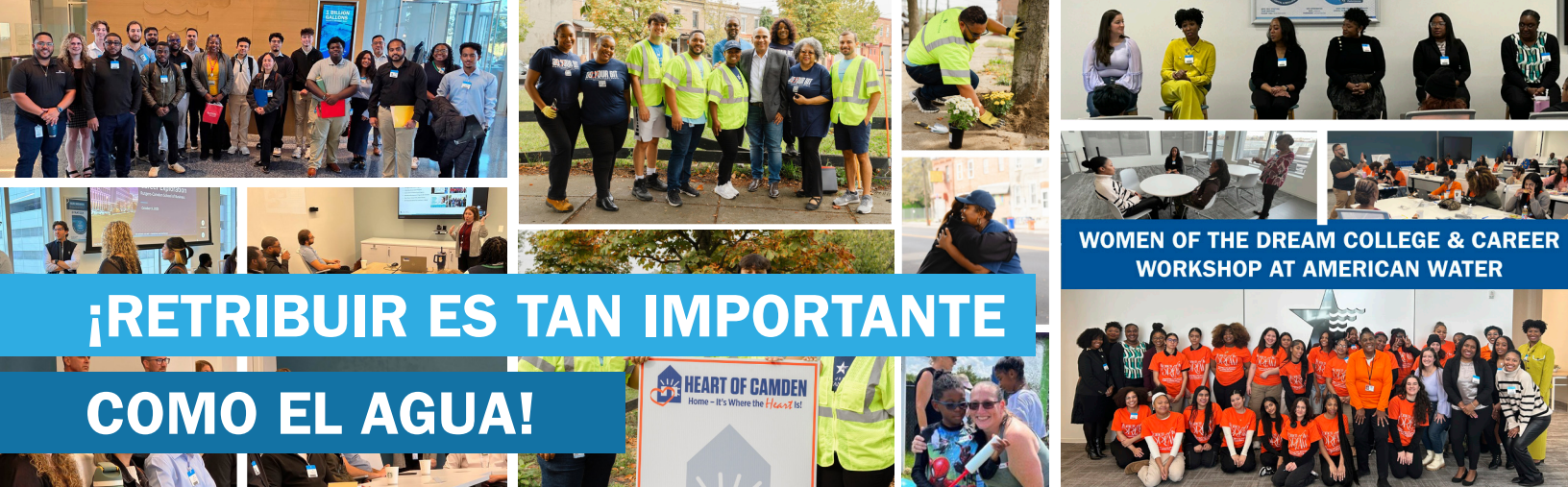
WOMEN OF THE DREAM COLLEGE & CAREER WORKSHOP AT AMERICAN WATER